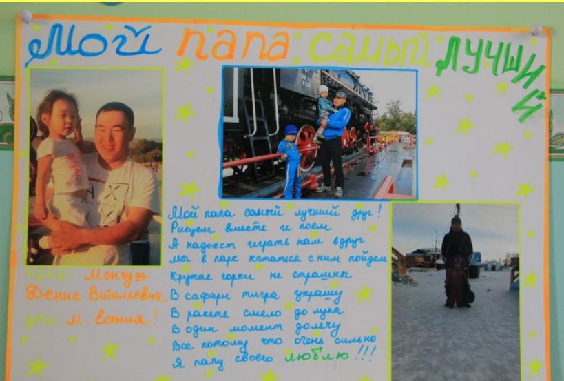
Стенгазет «Мой папа самый лучший»