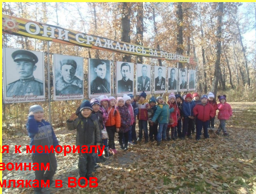
Экскурсия к мемориалу павшим воинам землякам в ВОВ