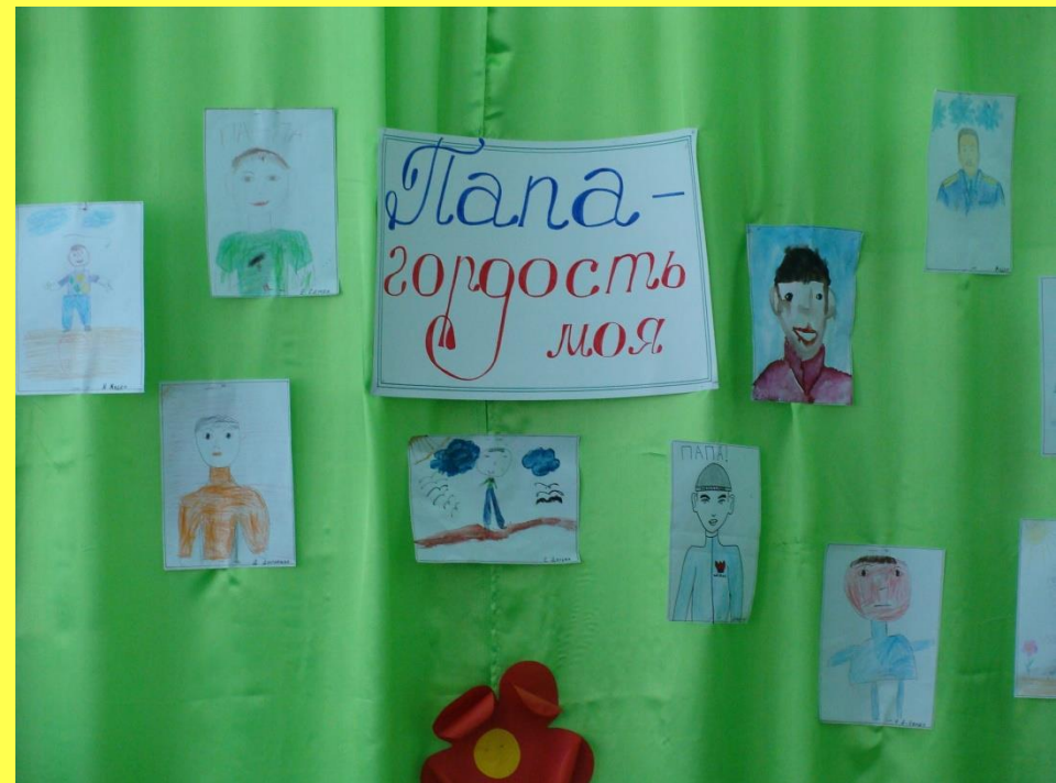
Выставка работ «Папа гордость моя»