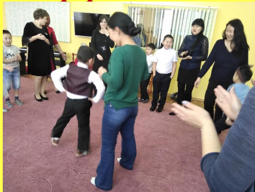
Игры с родителями