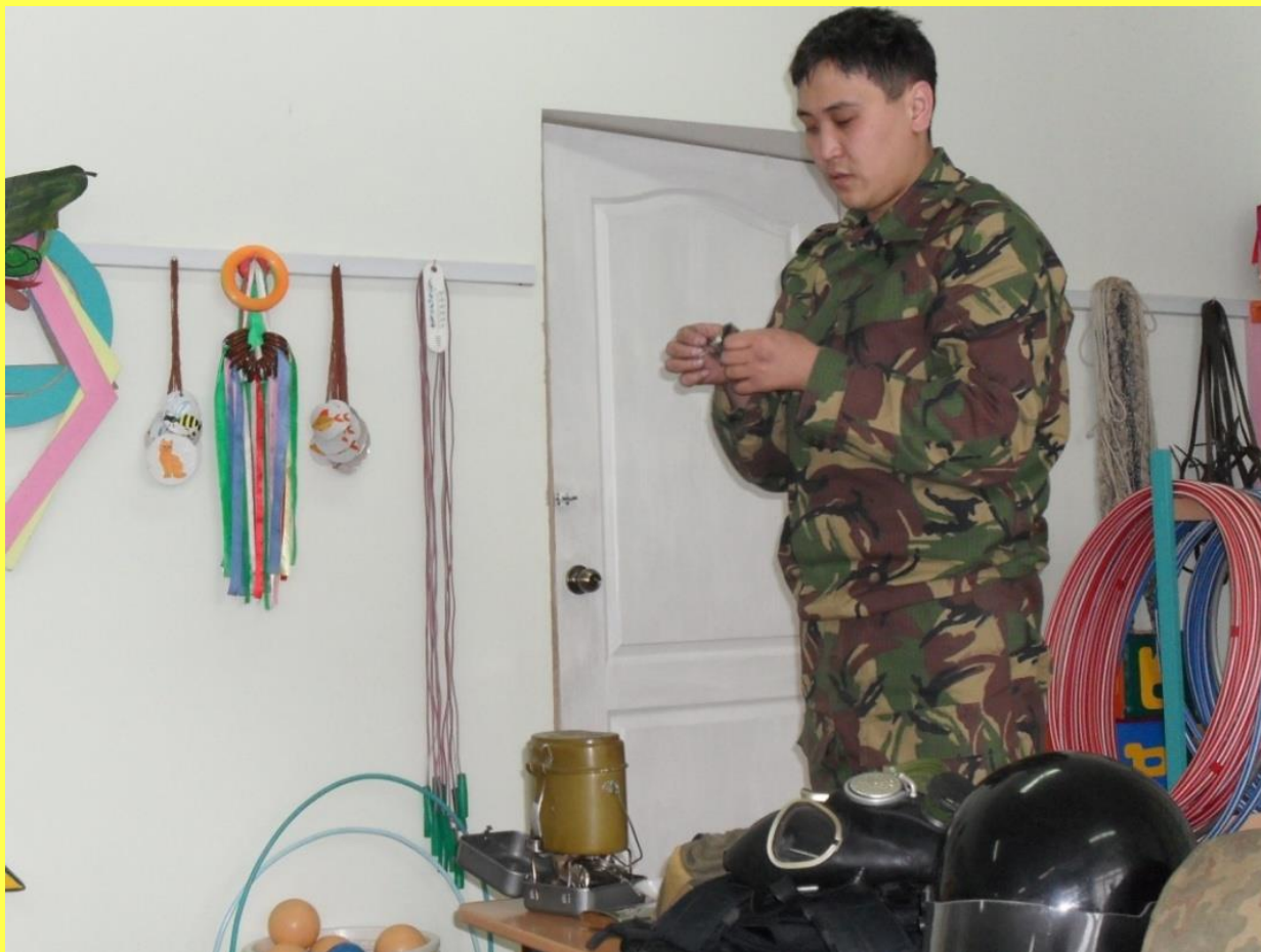
Папы в гостях у ребят