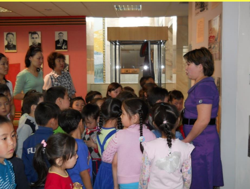
Экскурсия в музей