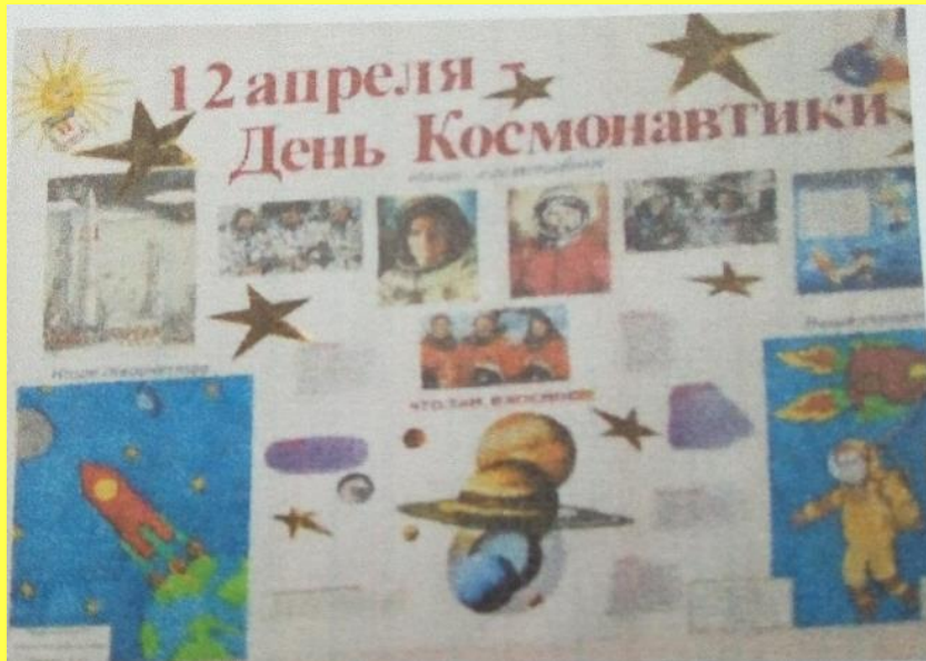
Стенгазет к дню Космонавтики